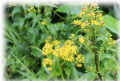
ミヤマアキノキリンソウ