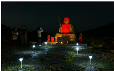
サマーナイトクルージング 蔵王地藏尊夜間参拝