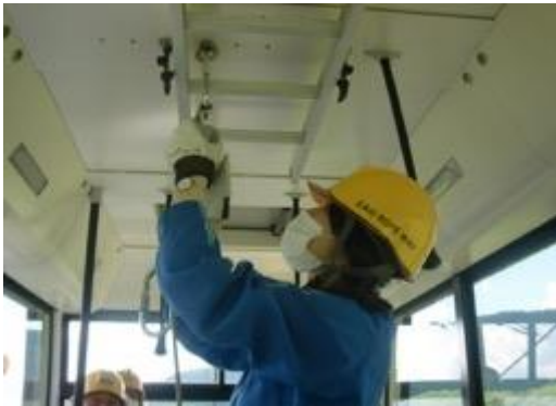
ロープウェイ山麓線 応急下降・予備原動機取扱い訓練